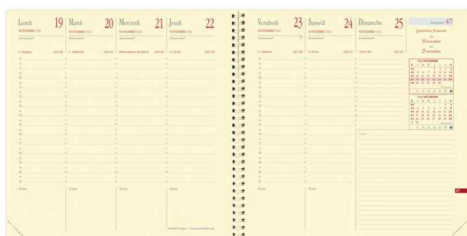
Agenda "Exécutif Prestige S", grille