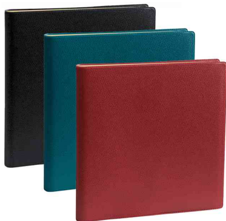
Agenda "Exécutif Prestige S", assorti