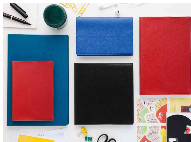
Visuel de référence: gamme IMPALA