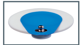
S = Druckknopf