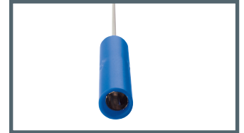
A = 4 mm Bananenstecker