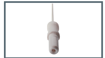
K = 1,5 mm Sicherheitsanschluss