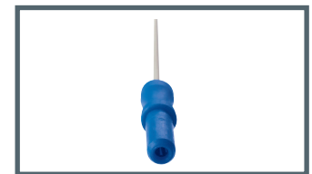
J = 2 mm Sicherheitsanschluss