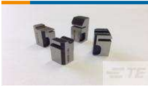
TE Teilnr.:462006-1 FLOATING SHEAR