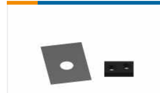
TE Teilnr.:455888-1 SPACER, CRIMPER(010)