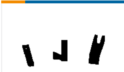
TE Teilnr.:691499-1 SPRING-FEED FINGER