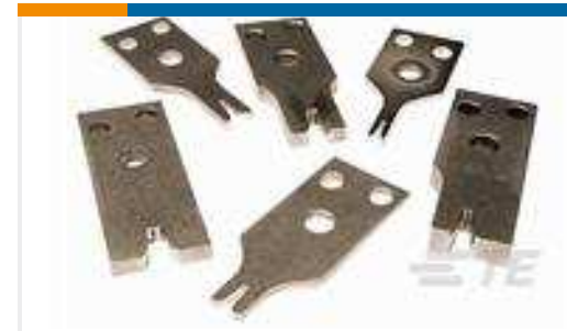
TE Teilnr.:1-456404-6 CRIMPER WIRE .070 F