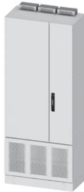
ALPHA DIN Trafo-SCHRANK H=1950mm B=800mm T=400mm incl. 100mm Sockel Stahlblechtuer geschlossen Seitenwand SK1, IP30