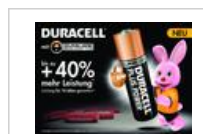
Anzeigenvorlage Duracell Plus Power 'Bis zu +40% mehr Leistung'