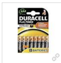
Duracell Plus Power- AAA(MN2400/ LR03) BPH8