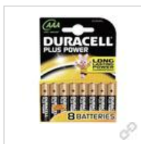
Duracell Plus Power- AAA(MN2400/ LR03) BPH8