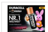
Anzeigenvorlage Duracell 'Die Batteriemarke Nr. 1 Weltweit'