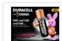
Anzeigenvorlage Duracell Plus Power 'Hält und hält...'