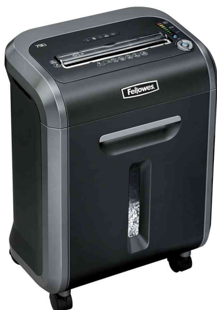
Aktenvernichter Powershred 79Ci