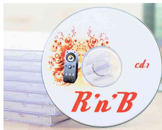
CD/DVD-Etiketten SPECIAL, Anwendung