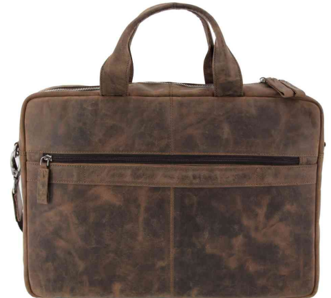
Notebook-Tasche "RAILEY", Rückansicht