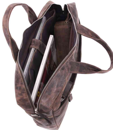
Notebook-Tasche "RAILEY", Innenansicht