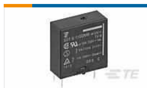
TE Teilnr.:8-1419125-5 SDT-S-106LMR,000