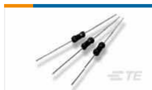
TE Teilnr.:4-1879350-2 RR01 5% 11R AMMO