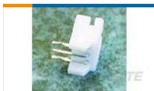
TE Teilnr.:1-440055-1 2.0MM,HDR,11POS,R/A