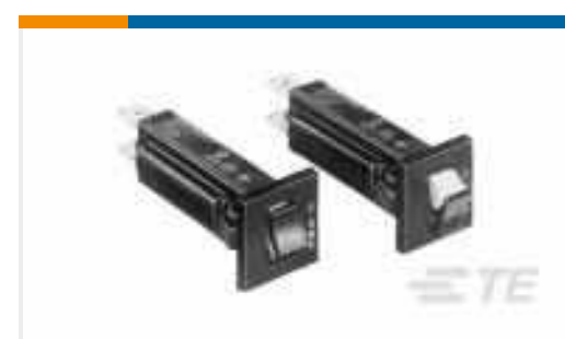
TE Teilnr.:1-1393250-7 W28-XQAT-15=W28