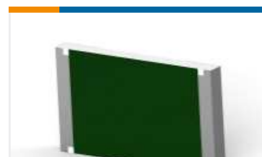
TE Teilnr.:8-2176407-8 3560 27R 5%