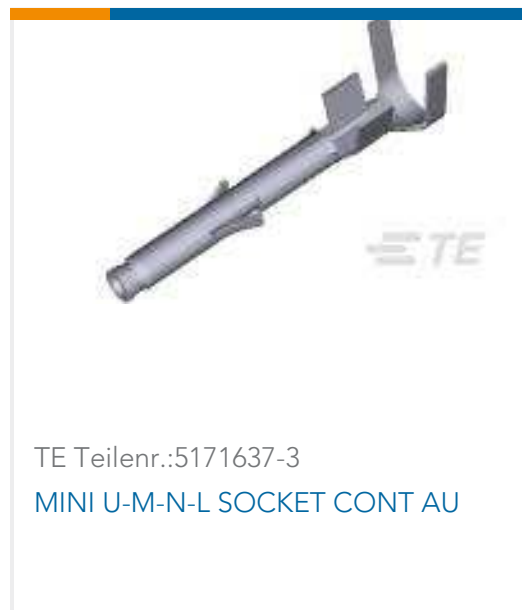
TE Teilnr.:5171637-3 MINI U-M-N-L SOCKET CONT AU