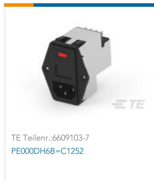
TE Teilnr.:6609103-7 PE000DH6B=C1252