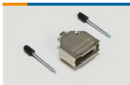
D-Sub-Abdeckkappen und Kabelklemmen(135)