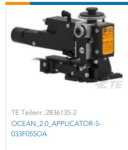
TE Teilnr.:2836135-2 OCEAN_2.0_APPLICATION-S-033F055OA