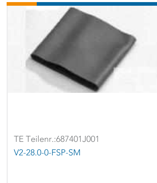
TE Teilnr.:687401J001 V2-28.0-0-FSP-SM