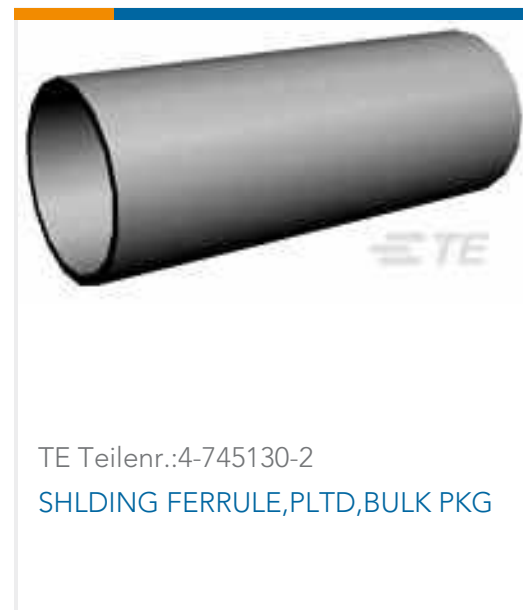
TE Teilnr.:4-745130-2 SHLDING FERRULE,PLTD,BULK PKG