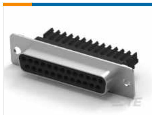
TE Teilnr.: CAT-AM7-248H5 D-Sub-Schneidklemmkontakte: Buchensatz, Kabel-an-Kabel, Signal, 2,77 mm