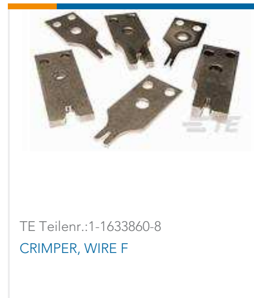
TE Teilnr.:1-1633860-8 CRIMPER, WIRE F