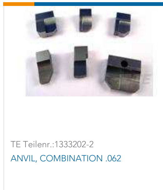
TE Teilnr.:1333202-2 ANVIL, COMBINATION .062