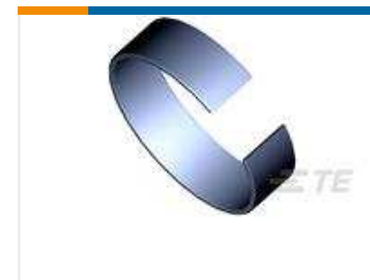
TE Teilnr.: 745508-8 FERRULE SPLIT RING, HD