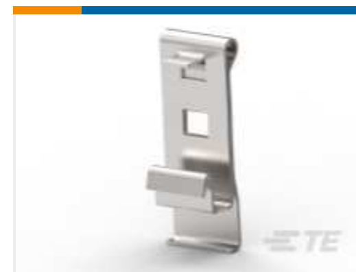
TE Teilnr.: 745255-2 SPRING LATCH 2/BAG