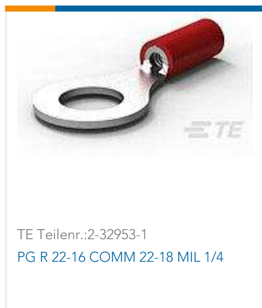
TE Teilnr.:2-32953-1 PG R 22-16 COMM 22-18 MIL 1/4