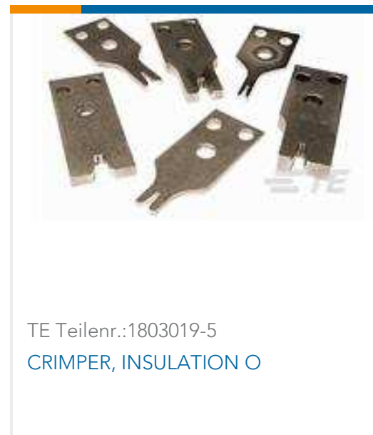
TE Teilnr.:1803019-5 CRIMPER, INSULATION O