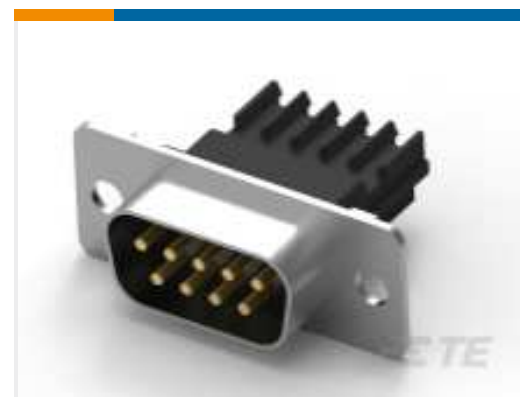
TE Teilnr.: CAT-AM7-248H3 D-Sub-Schneidklemmkontakte: Steckersatz, Kabel-an-Kabel, Signal, 2,77 mm