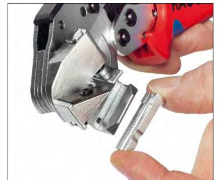
problemloser Austausch der Aderführung Easily interchangeable tube guide