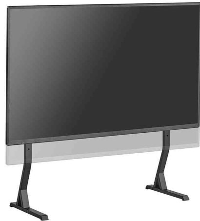
TV-Ständer, Höhe einstellbar