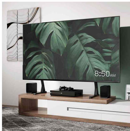
Visuel de référence: présente le produit en utilisation