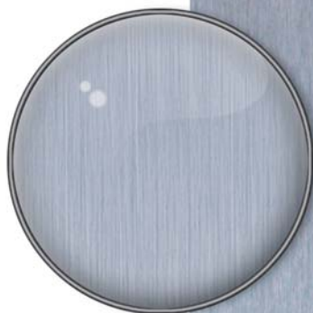
Frontplatte aus gebürstetem Edelstahl.

Die Lichtfarbe ist von kalt-weiß bis warm-gelb stufenlos einstellbar.