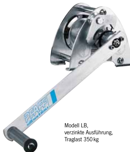
Modell LB, verzinkte Ausführung, Traglast 350 kg