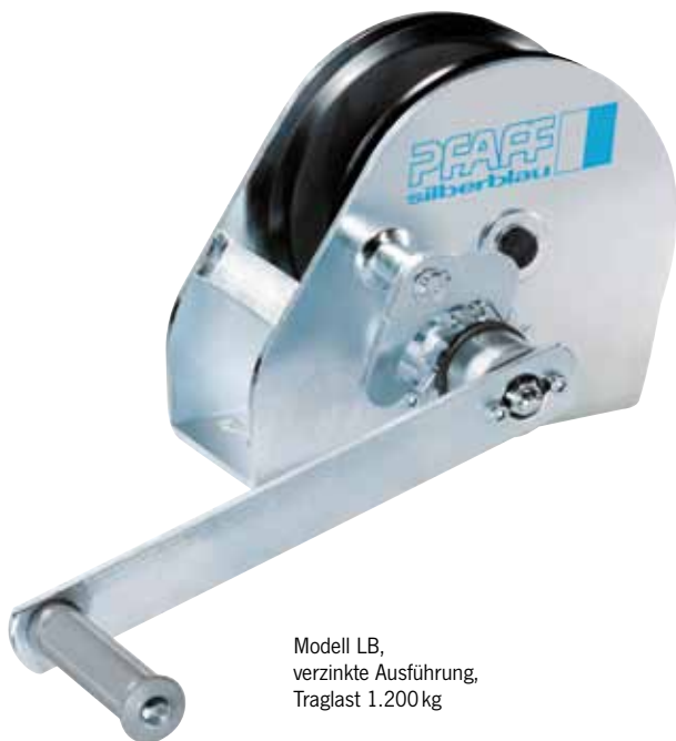
Modell LB, verzinkte Ausführung, Traglast 1.200 kg