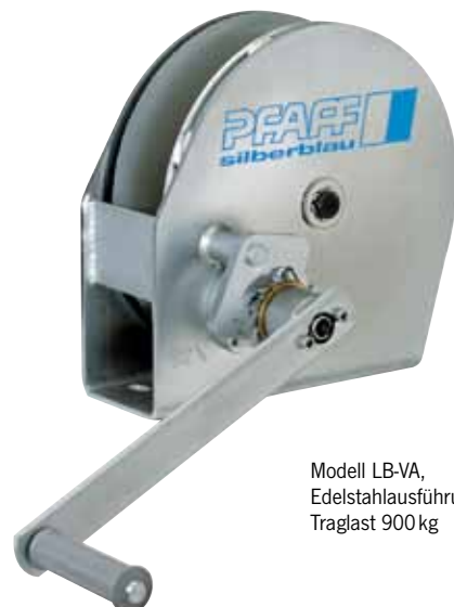
Modell LB-VA, Edlestahlausführung, Traglast 900 kg