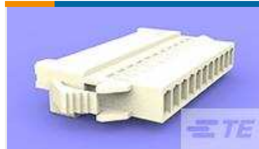
TE Teilnr.:1-1969590-4 HSG, REC, PANEL MOUNT, SINGLE ROW,EP2.5