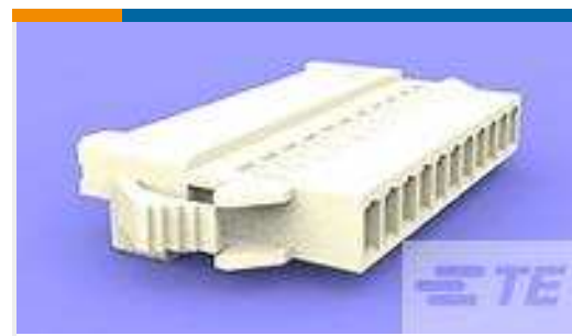
TE Teilnr.:1969590-7 HSG, REC, PANEL MOUNT, SINGLE ROW,EP2.5