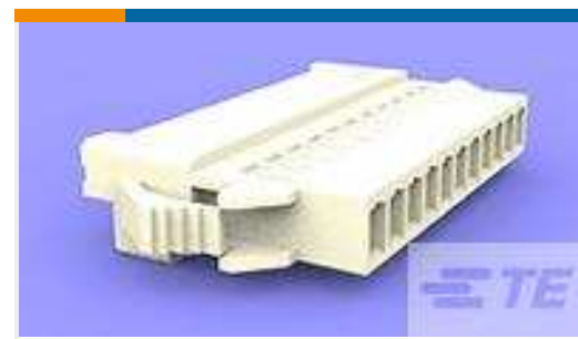
TE Teilnr.:1969590-8 HSG, REC, PANEL MOUNT, SINGLE ROW,EP2.5