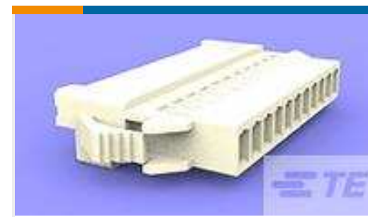
TE Teilnr.:1-1969590-1 HSG, REC, PANEL MOUNT, SINGLE ROW,EP2.5