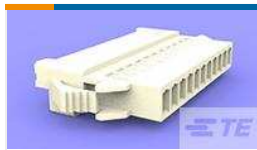
TE Teilnr.:1969590-4 HSG, REC, PANEL MOUNT, SINGLE ROW,EP2.5