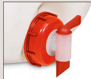
Typ H 50