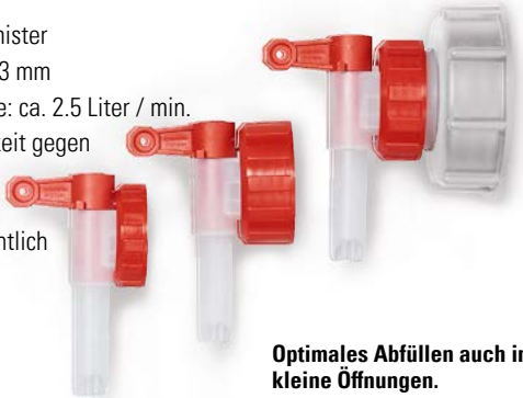
Optimales Abfüllen auch in kleine Öffnungen.