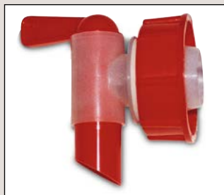
Typ H 45