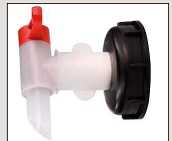
Typ H 61