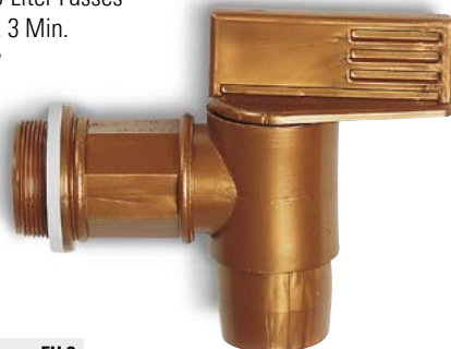
Kunststoff-Fasshahn mit 2"-Gewinde, Bestell-Nr. 117-105-J9