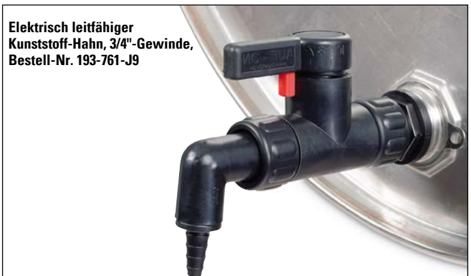
Elektrisch leitfähiger Kunststoff-Hahn, 3/4"-Gewinde, Bestell-Nr. 193-761-J9