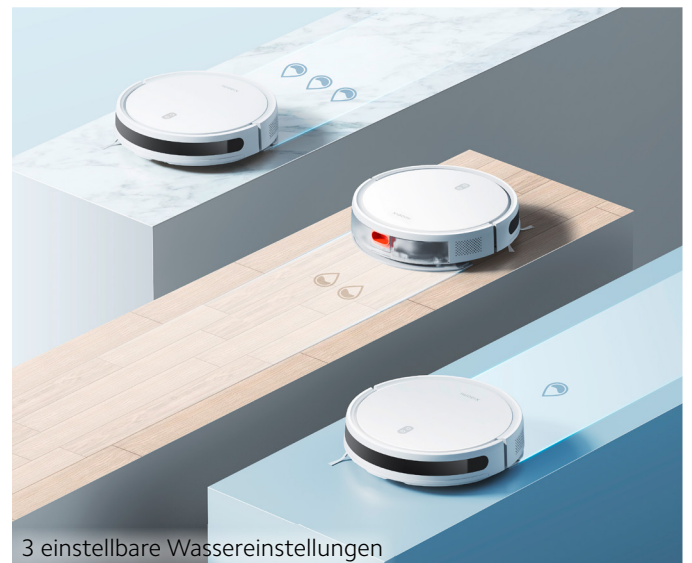
3 einstellbare Wassereinstellungen