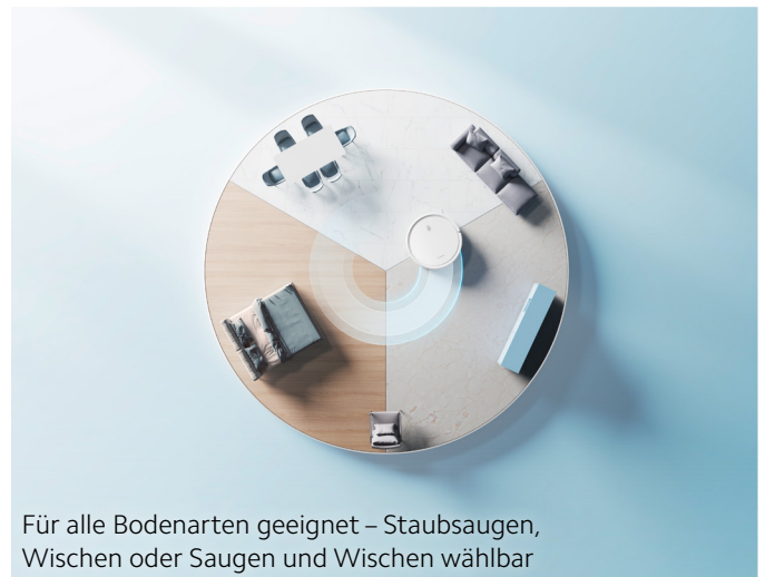
Für alle Bodenarten geeignet – Staubsaugen, Wischen oder Saugen und Wischen wählbar