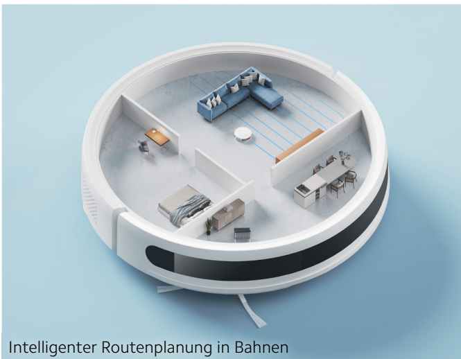
Intelligenter Routenplanung in Bahnen