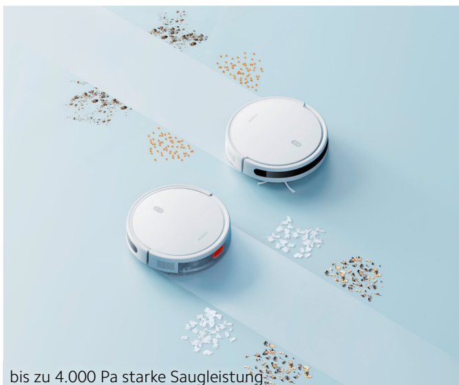
bis zu 4.000 Pa starke Saugleistung