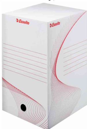
Boîte d'archivage, 200 mm