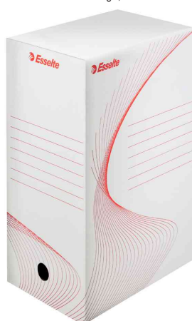
Visuel de référence: Boîte d'archivage