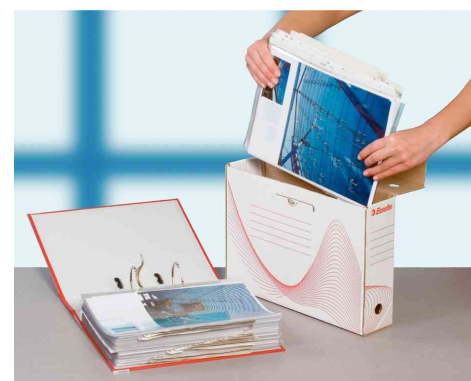
Visuel de référence: présente le produit en utilisation