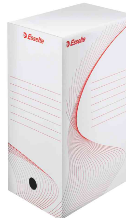
Boîte d'archivage, 150 mm