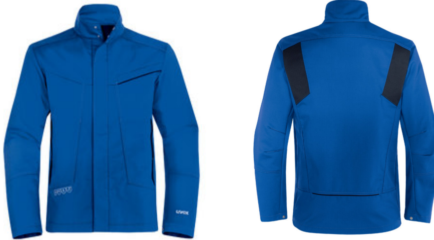
Modell: 07364 Art.-Nr.: 89720