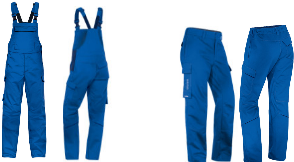
Modell: 07366 Art.-Nr.: 89722