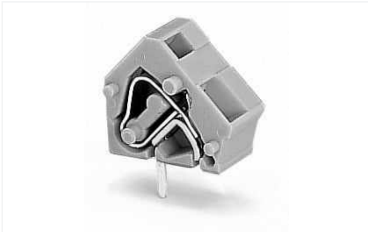
Farbe: ■ grün