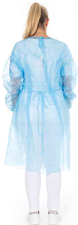
Blouse PP avec bande pour la nuque, vue de dos