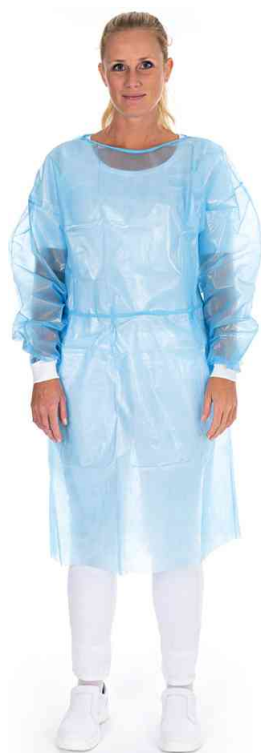
Blouse PP avec bande pour la nuque, en utilisation