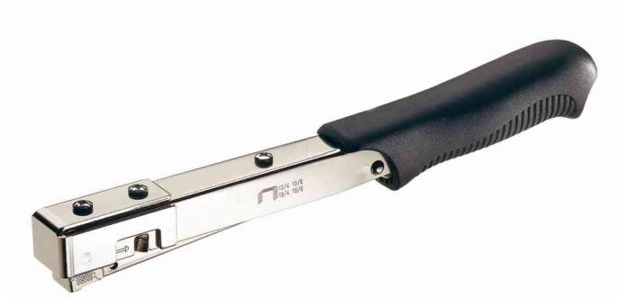
Hammertacker PRO R19E