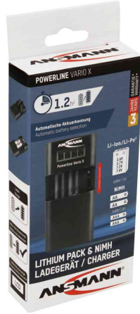
Ladegerät Powerline Vario X, Verpackung