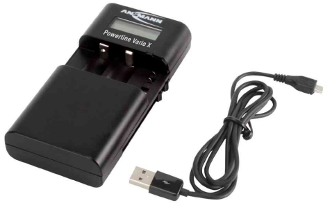
Ladegerät Powerline Vario X