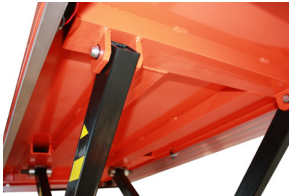
Profiel verstevigd blad

De universele stationaire heftafel voor het heffen van zware lasten kan plaatsbesparend toegepast worden door de heftafel in een put te plaatsen.