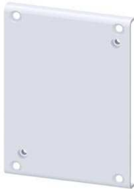
Adapterplatte zum Austausch von Schützen 3TF52 / 3TK52 auf SIRIUS 3RT1.5