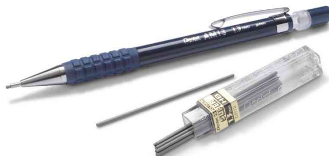
Contenu : Porte-mines et mines