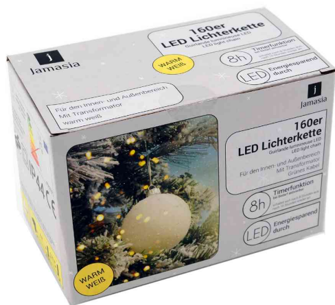
Guirlande lumineuse LED, 160 ampoules