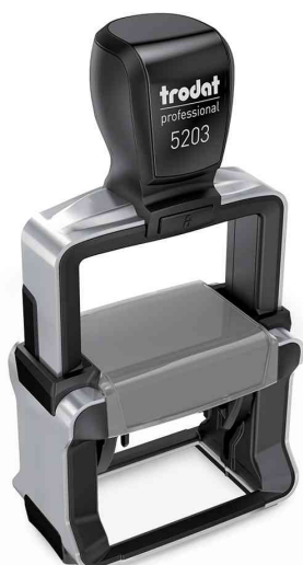
Tampon pour texte Professional 4.0 5203

Info: nous livrons tous les tampons configurables à domicile à partir d'une commande d'une pièce! S'il vous plaît, tenez compte du fait que les tampons configurables sont toujours traités dans une commande séparée!