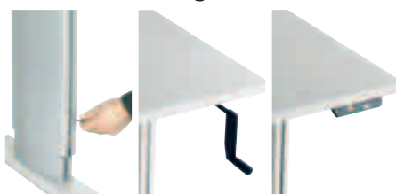
mit Inbusschrauben mit Handkurbel mit Elektromotor

Einfaches Verstellen der Arbeitshöhe von 700 - 1100 mm für Sitz- oder Steharbeitsplätze.