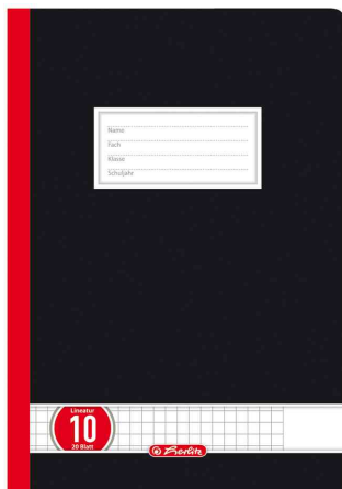
Cahier d'école supérieure x.book, quadrillé