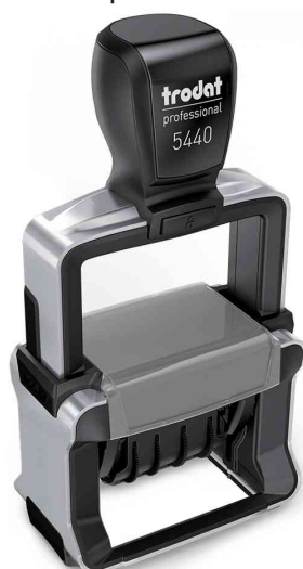
Datumsstempel Professional 4.0 5440/L

Zubehör: Ersatzstempelkissen: auf Blisterkarte, Abgabe nur in ganzen VE's