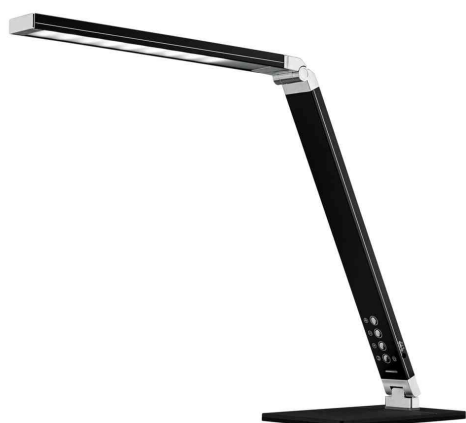
Lampe de bureau à LED Magic Light