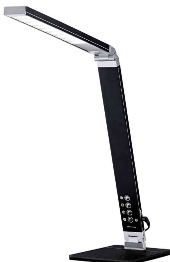
Lampe de bureau à LED Magic Light, vue de face