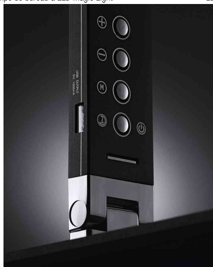
Vue détaillée: commande et port USB