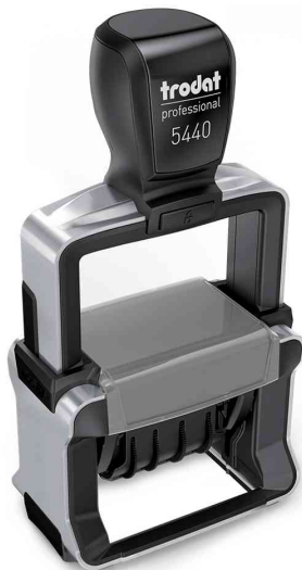
Datumsstempel Professional 4.0 5440/L

Zubehör: Ersatzstempelkissen: auf Blisterkarte, Abgabe nur in ganzen VE's