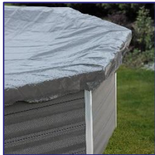
CIKPCOR28 Winterabdeckplane Winter cover