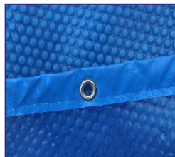
CVKPCOR28 Isothermabdeckplane Isothermic cover