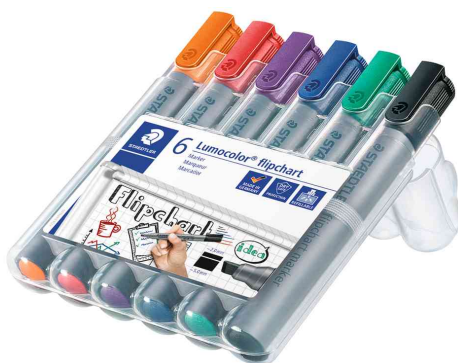
Marqueur de conférence 356B Lumocolor, étui de 6