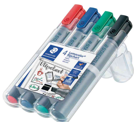
Marqueur de conférence 356B Lumocolor, étui de 4