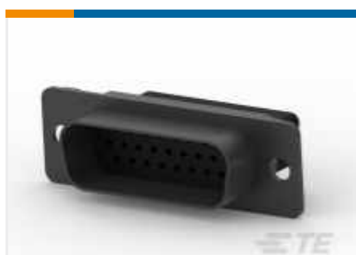
TE Teilnr.: CAT-038-DCPPS222 D-Sub-Crimpverbindung: Stecker, Signal, 26 Positionen, Stiftgröße 22, Gehäusegröße 2