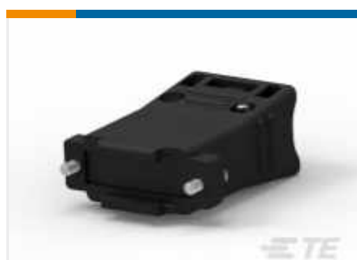
TE Teilnr.: 5206471-1 CABLE CLAMP KIT, SZ 2