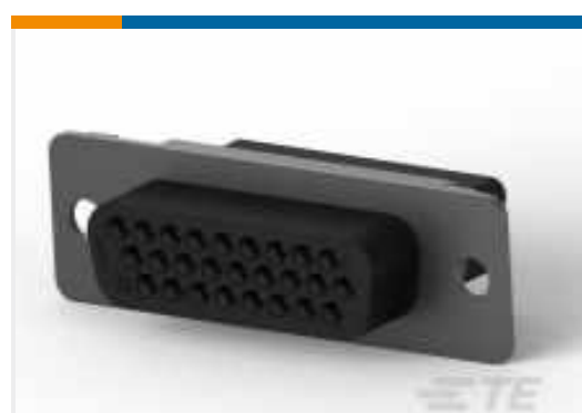
TE Teilnr.: CAT-038-DCRSS222 D-Sub-Crimpverbindungsbuchse: Signal, 26 Positionen, Buchsengröße 22, Gehäusegröße 2