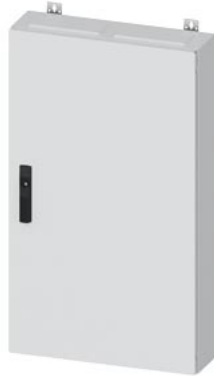
ALPHA 160 DIN AP-Wandverteiler Aufputz Leerschrank IP44 Schutzklasse II H=950mm, B=550mm T=140mm, RAL 9016