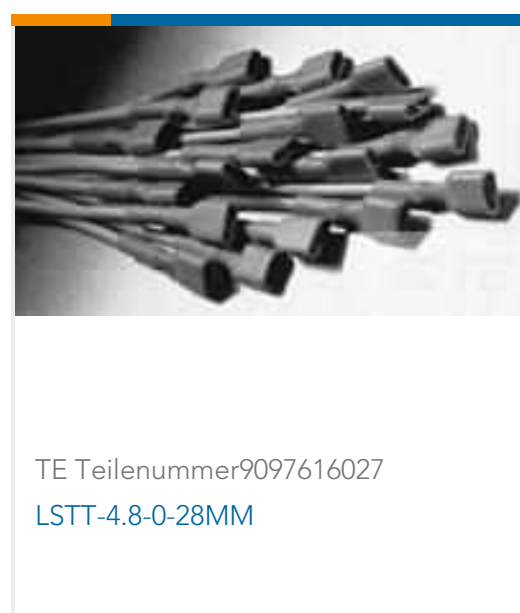
TE Teilenummer9097616027 LSTT-4.8-0-28MM