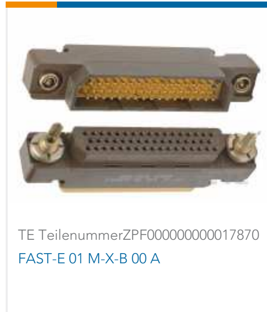
TE TeilenummerZPF00000000017870 FAST-E 01 M-X-B 00 A