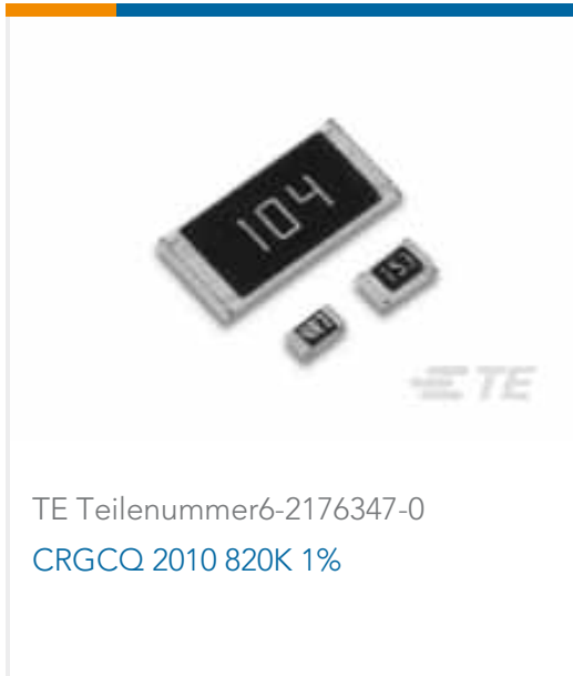
TE Teilenummer6-2176347-0 CRGCQ 2010 820K 1%