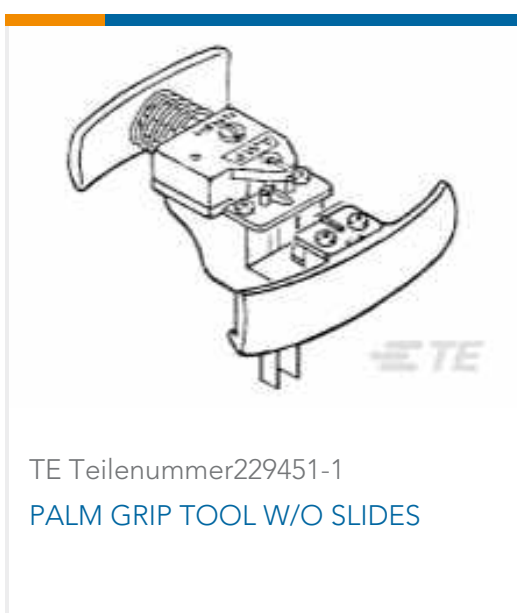
TE Teilenummer229451-1 PALM GRIP TOOL W/O SLIDES