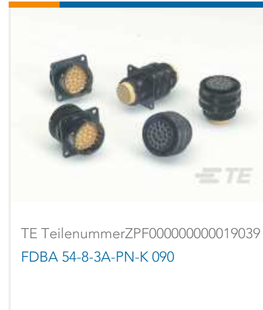
TE TeilenummerZPF00000000019039 FDBA 54-8-3A-PN-K 090