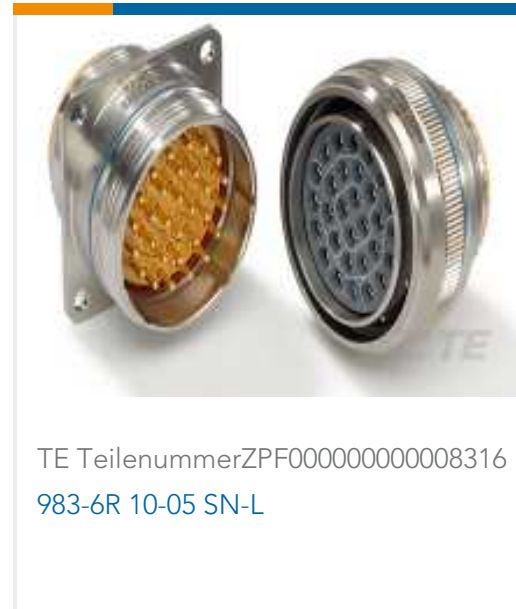
TE TeilenummerZPF00000000008316 983-6R 10-05 SN-L