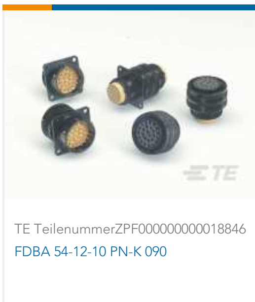
TE TeilenummerZPF00000000018846 FDBA 54-12-10 PN-K 090