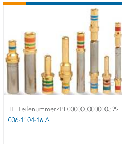
TE TeilenummerZPF00000000000399 006-1104-16 A