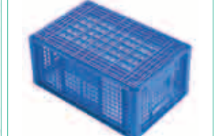
Rippenboden gegen Verschmutzung bei durchbrochenen Behältern