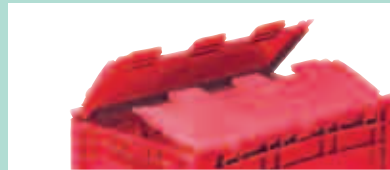
> Behälter mit Scharnierdeckel siehe Seite 442