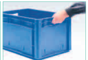
Ergonomische Durchfass-Griffe an den Stirnseiten