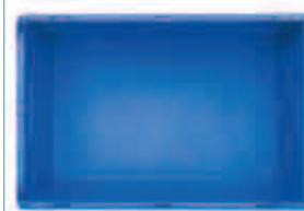
Glatte Innenwände für leichte Reinigung bei geschlossenen Behältern