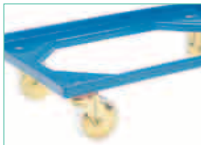
Transportroller 620 x 420 mm, abgestimmt auf Behältermaße