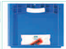
Halterungen für Belege, Größe 210 x 74 auf allen Seiten