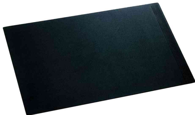
Sous-main LA LINEA, noir