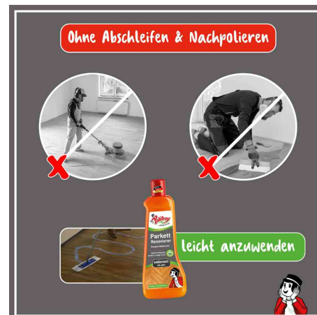
facile à utiliser - sans ponçage ni polissage ultérieur