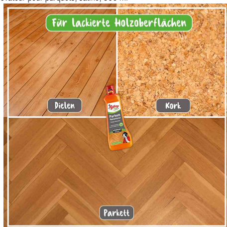
pour les sols en bois vitrifiés