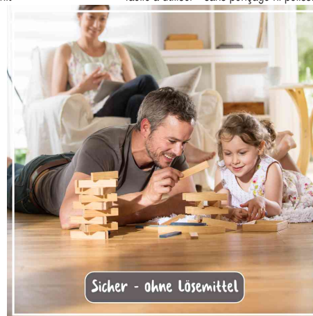
sans risques - sans solvants