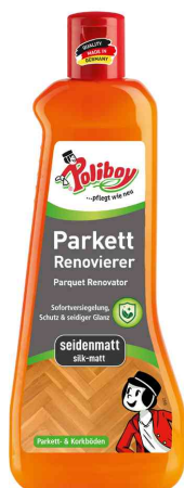
Rénovateur pour parquets, satiné, 500 ml