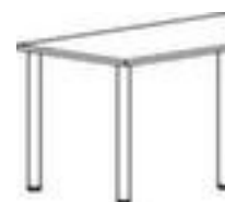
Table de conférence