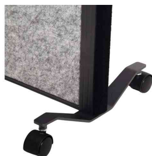
Vue détaillée: pied à roulette