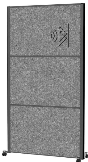
Surface: acoustique gris foncé (9601189)