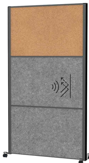
Surface: acoustique gris foncé / liège (9605189)