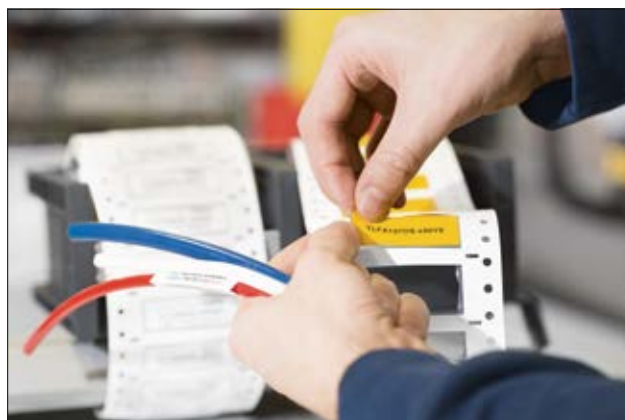
Schrumpfschlauchmarkierer TLFX DS mit geringer Brandgefahr für die Bahnindustrie.