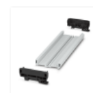
1310935 - 00036658_STAND ARD_PICTURE_01_SRGB.png