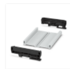
1310946 - 00036642_STAND ARD_PICTURE_01_SRGB.png