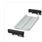
1310953 - 00036679_STAND ARD_PICTURE_01_SRGB.png