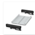
1310989 - 00036678_STAND ARD_PICTURE_01_SRGB.png