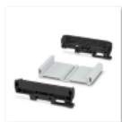
1310939 - 00036656_STAND ARD_PICTURE_01_SRGB.png