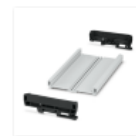
1310949 - 00036644_STAND ARD_PICTURE_01_SRGB.png