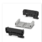
1310823 - 00036643_STAND ARD_PICTURE_01_SRGB.png