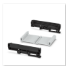
1310983 - 00036659_STAND ARD_PICTURE_01_SRGB.png