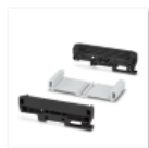
1310938 - 00036677_STAND ARD_PICTURE_01_SRGB.png