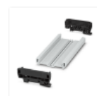
1310932 - 00036654_STAND ARD_PICTURE_01_SRGB.png