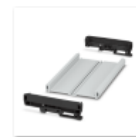
1310990 - 00036675_STAND ARD_PICTURE_01_SRGB.png