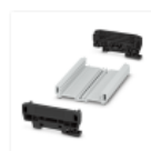
1310929 - 00036663_STAND ARD_PICTURE_01_SRGB.png