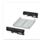
1310988 - 00036681_STAND ARD_PICTURE_01_SRGB.png