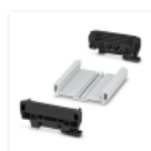
1310928 - 00036674_STAND ARD_PICTURE_01_SRGB.png