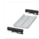
1310991 - 00036657_STAND ARD_PICTURE_01_SRGB.png