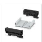
1310926 - 00036673_STAND ARD_PICTURE_01_SRGB.png