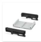
1310984 - 00036645_STAND ARD_PICTURE_01_SRGB.png