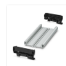
1310933 - 00037831_STAND ARD_PICTURE_01_SRGB.png