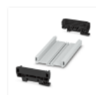
1310930 - 0036676_STAND ARD_PICTURE_01_SRGB.png