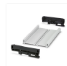
1310948 - 00036680_STAND ARD_PICTURE_01_SRGB.png