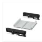
1310987 - 00036655_STAND ARD_PICTURE_01_SRGB.png