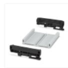
1310942 - 00036665_STAND ARD_PICTURE_01_SRGB.png