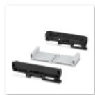
1310981 - 00036664_STAND ARD_PICTURE_01_SRGB.png