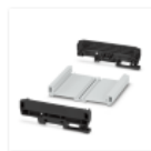
1310941 - 00036666_STAND ARD_PICTURE_01_SRGB.png