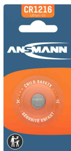
Pile bouton au lithium, CR1216