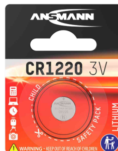
Pile bouton au lithium, CR1220