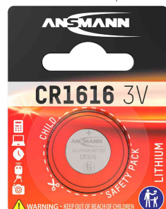
Pile bouton au lithium, CR1616