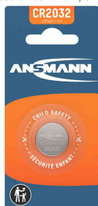
Pile bouton au lithium, CR2032