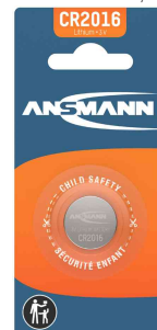
Pile bouton au lithium, CR2016