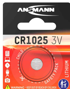
Pile bouton au lithium, CR1025