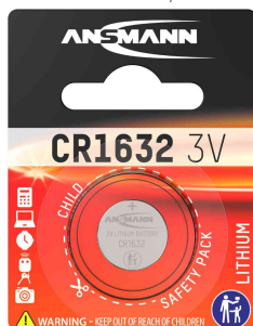
Pile bouton au lithium, CR1632