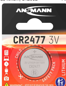
Pile bouton au lithium, CR2477