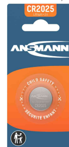
Pile bouton au lithium, CR2025