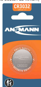
Pile bouton au lithium, CR3032