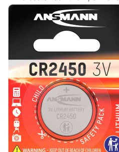
Pile bouton au lithium, CR2450