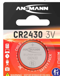
Pile bouton au lithium, CR2430