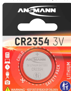
Pile bouton au lithium, CR2354