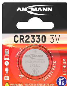
Pile bouton au lithium, CR2330