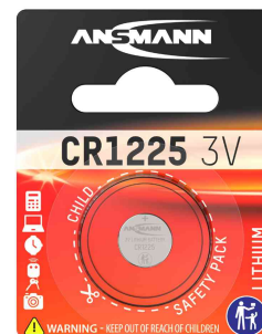
Pile bouton au lithium, CR1225