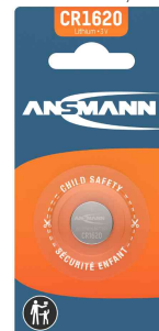
Pile bouton au lithium, CR1620