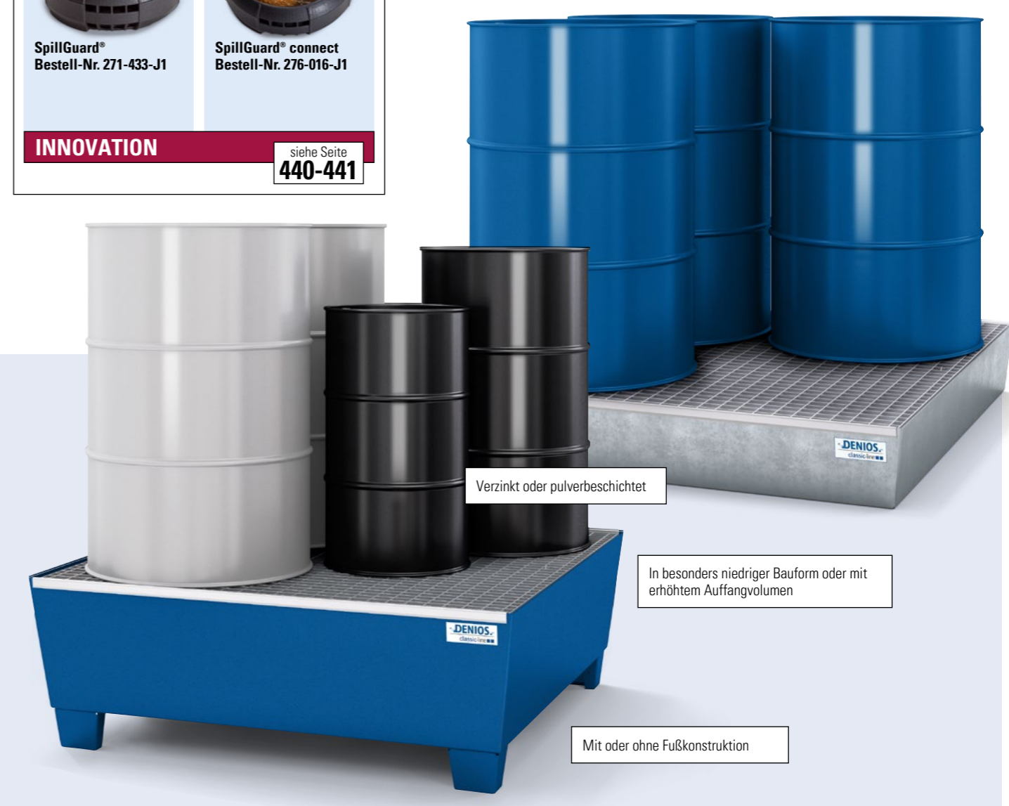
Verzinkt oder pulverbeschichtet

i DENIOS classic-line - Lösungen für jede Anwendung, z.B. Lagerung von bis zu 12 Fässern auf einer Wanne, Schutz großer Flächen oder Abfüllen und Transportieren von Gefahrstoffen.