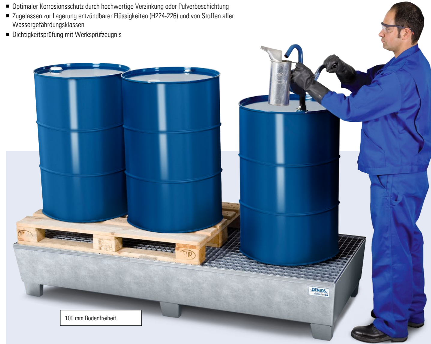
100 mm Bodenfreiheit