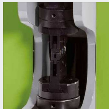
Modell CM 25-6 – Crimpmaschine mit reduziertem Hub ohne Schutzvorrichtung