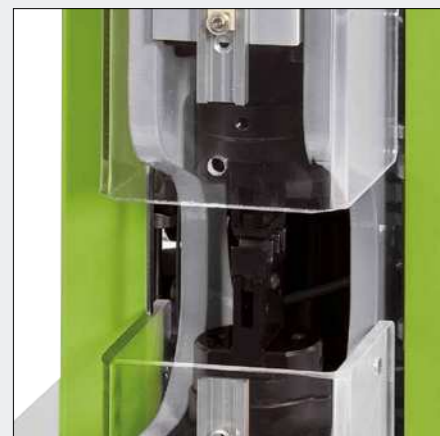
Modell CM 25-1 – Crimpmaschine für universellen Einsatz mit Schutzvorrichtung