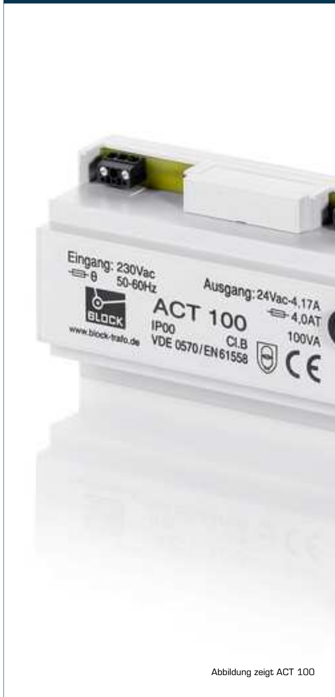
Abbildung zeigt ACT 100