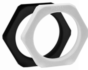
Type KGM: Contre-écrou plastique