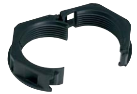
Type GMT: Contre-écrou ouvrable